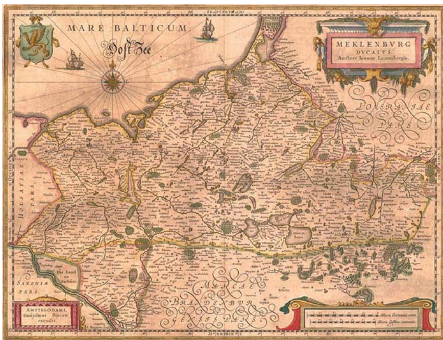
Mecklenburg um 1645

Die Masse der Bevölkerung bildeten im Mittelalter die Bauern. Sie erlebten in Mecklenburg besonders im Hoch- und Spätmittelalter ihre Blütezeit. Parallel bildete sich ein starker Ritterstand heraus, welcher für die weitere Geschichte Mecklenburgs bedeutend werden sollte. Weitere unruhige Jahre von Fehden