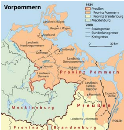
Vorpommern um 1934 und heute

den an Polen gefallenen Gebieten wurde vertrieben. Die Maßnahmen waren zuvor durch die Potsdamer Konferenz bestätigt worden.