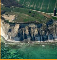
• Burgwall am Kap Arkona