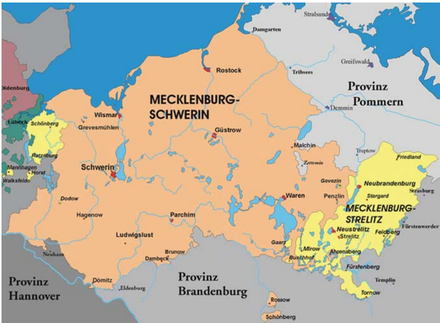
Mecklenburg um 1880

Mecklenburg zu Wahlen. Die erste Abgeordnetenversammlung erarbeitete eine Verfassung, die eine konstitutionelle Monarchie einführt. Im so genannten Freienwalder Schiedsspruch vom 14. September 1850 wurde diese auf Betreiben der Ritterschaft und des Großherzogs von Mecklenburg-Strelitz wieder aufgehoben. Damit galt in beiden Teilen Mecklenburgs wieder der Landesgrundgesetzliche Erbvergleich von 1755. Nach der damit endgültig gescheiterten Revolution wanderten in der zweiten Hälfte des