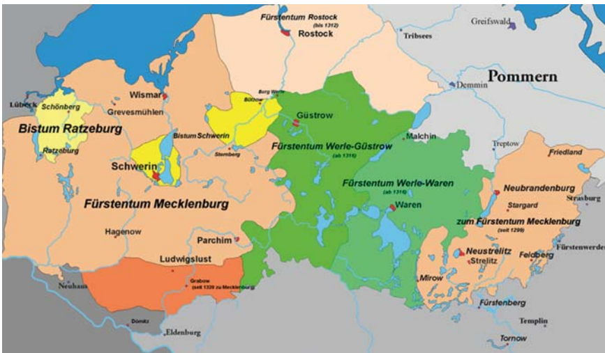
Mecklenburg um 1300

Burg und dem Land Bützow aus und begleitete Heinrich den Löwen schließlich 1171 nach Jerusalem. Pribislaw gelang es, Mecklenburg unter seiner Herrschaft zu vereinen. Auch Heinrich Borwin I. ab 1201 und Heinrich Borwin II. ab 1219 regierten über das ganze Land. Nach dessen Tod wurde das Land zunächst von seinen vier Söhnen gemeinsam verwaltet, dann aber in der ersten Hauptlandesteilung in vier Fürstentümer (Mecklenburg, Werle, Parchim-Richenberg und Rostock) geteilt. Es folgten zahlreiche weitere Teilungen und Zusammenschlüsse. Ständige Spannungen und Fehden zwischen den Fürstentümern