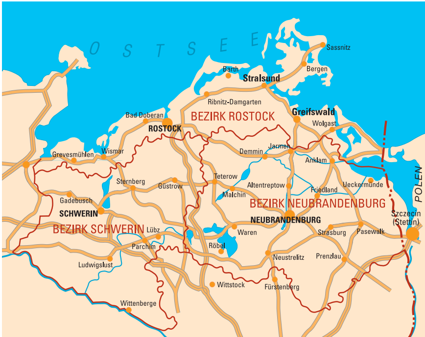
Mecklenburg um 1989

schaften in den Westen. Unternehmer, Gewerbetreibende und gut ausgebildete Facharbeiter folgten. Erst nach dem Mauerbau 1961 stabilisierte sich die Zahl der Einwohner und stieg in Folge der Umgestaltung der Agrar- und Industriestruktur sogar an.