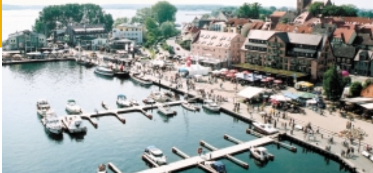
Hafen in Waren (Müritz)

Menschen in Deutschland und Europa erfahren über den NDR aus erster Hand, was bei uns in Mecklenburg-Vorpommern passiert. Sie werden angeregt zu uns zu kommen oder halten Kontakt zu uns. Der NDR ist damit ein wichtiger Botschafter des Landes.